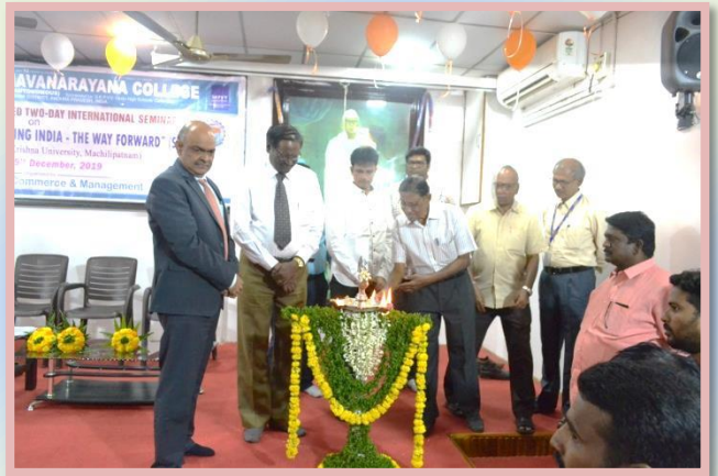
Lighting the Lamp