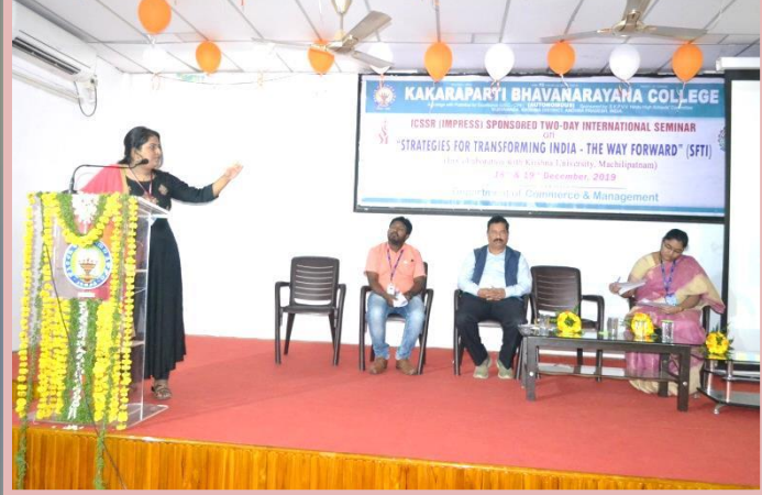
Paper presentation by Participants