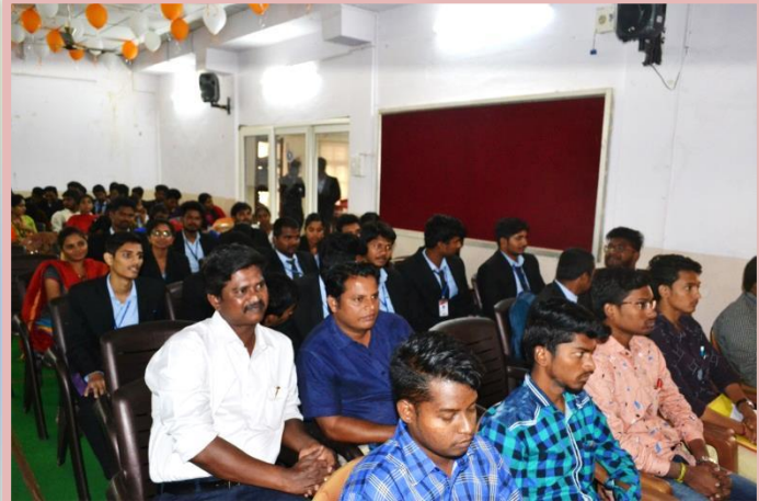
Participants at the Technical Session